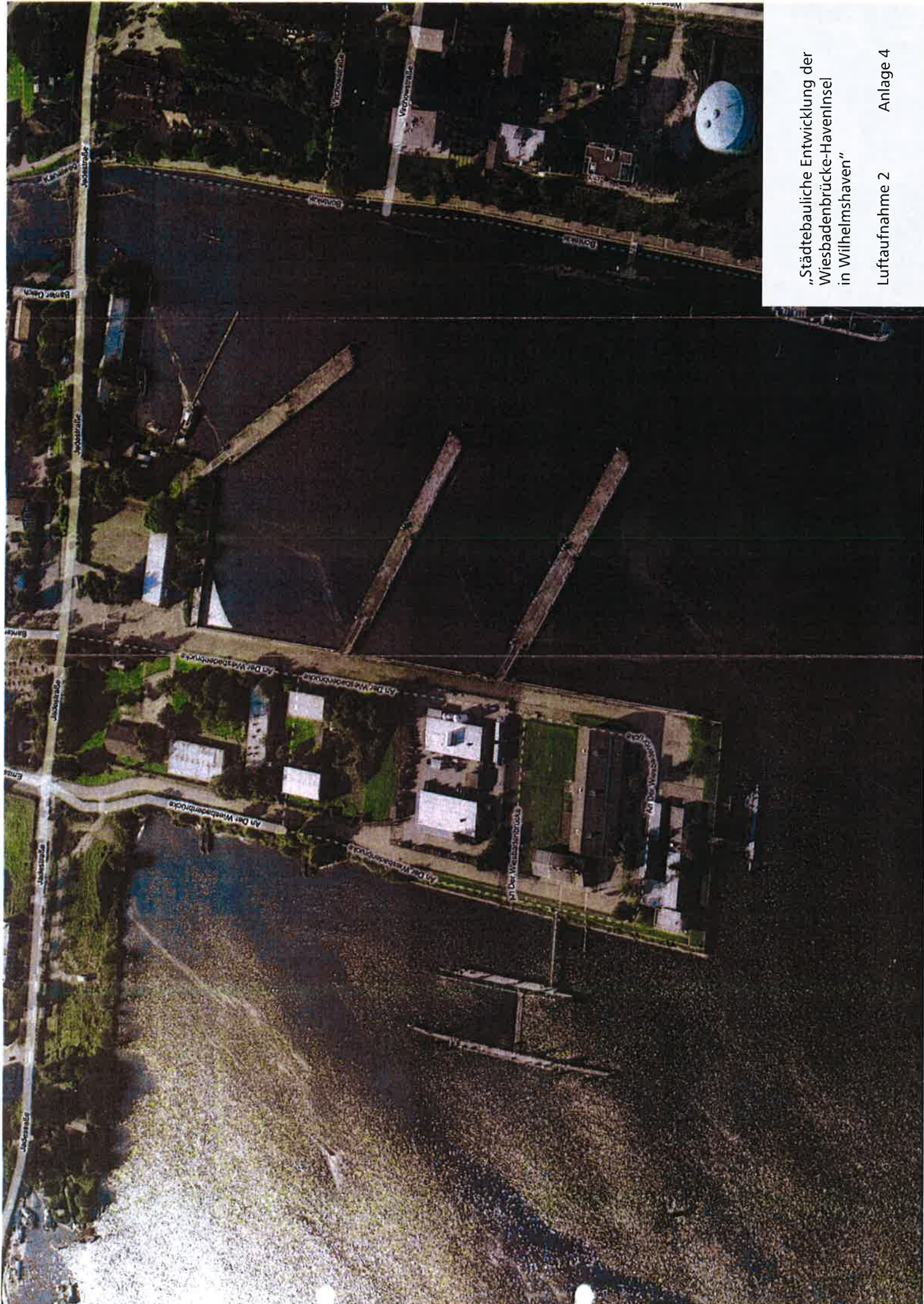
„Städtebauliche Entwicklung der Wiesbadenbrücke-Haveninsel in Wilhelmshaven“